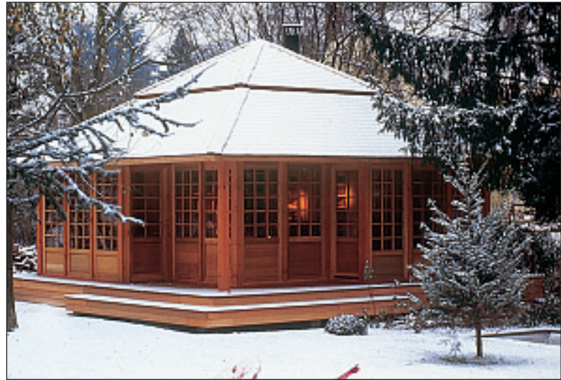
Réalisation: A. Doyen